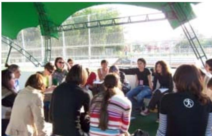
Unul dintre workshop-urile manifestarii.

Festivalul a insemnat trei zile de ateliere, expozitii, proiectii si concerte live care au atras un public variat. Una dintre concluziile noastre a fost ca in spatiul public romanesc, conceptia unui eveniment ca si Ladyfest este completamente exotica. Audienta s-a impartit in doua categorii mari. Intii, au fost persoane (majoritatea femei dar nu numai) care au venit in timpul zilei sa participe la ateliere si sa se intalneasca cu alte femei active pe taramul grassroots feminist. Ele constituiau in fond grupul nostru tinta, si au participat ca organizatoare, artiste si activiste, impartasind informatii despre propriile activitati si planuind proiecte si actiuni comune pentru viitorul apropiat. Ele au fost putine, dar au gasit un loc extraordinar de ospitalier pentru ideile lor si s-au implicat la toate nivelele, majoritatea dedicand mult timp si ajutor pentru buna-desfasurare a festului. Cealalta categorie au format-o cei care au venit in mod explicit pentru concerte (majoritatea barbati). Erau putin interesati de expozitie si arta, sau de proiectiile de filme. Desi ne-am bucurat ca au participat la cele trei zile de festival atat femei cat si barbati, stiam ca cei care au venit numai pentru muzica aveau (mai) putin de-a face cu perspectiva feminista asupra societatii si nu internalizau necesitatea pentru un spatiu al femeii, unde femei se pot aduna si exprima.