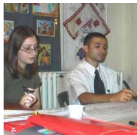
Membri ai AnA.

a avut ca obiectiv principal instruirea reprezentantilor ONG-urilor din Romania in vederea integrarii perspectivei de gen in activitatile si proiectele acestora. Etapele concrete ale proiectului au vizat: realizarea unei cercetari, care sa evalueze gradul de integrare a problematii de gen in programele si activitatile ONG-urilor din Romania, in vederea stabilirii unor domenii si tipuri de ONGuri adecvate pentru a fi incluse in programul de instruire; elaborarea de suporturi de instruire condensate si atractive (materiale informativ-formative pe tema programului, personalizate la tipurile de ONG-uri incluse in faza de instruire); conceperea si implementarea unui program de instruire (directa si tip cascada) care sa includa in final un numar de 40 ONG-uri (si aproximativ 100 persoane); elaborarea de publicatii (versiuni tiparite si electronice: suporturi de curs, tur virtual, ghid de bune practici, numar special al revistei AnaLize etc).