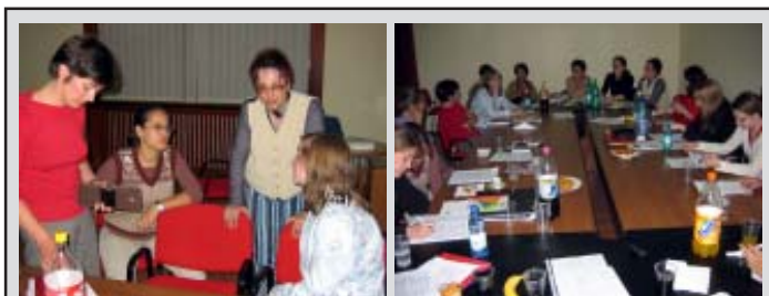
Imagini de la intalnirea GAD din Timisoara.